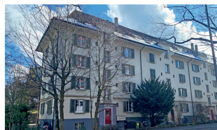
Stadt Bern Mehrfamilienhaus Bewertungsauftrag 2023