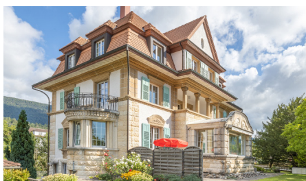
Lengnau Ehemalige Fabrikantenvilla