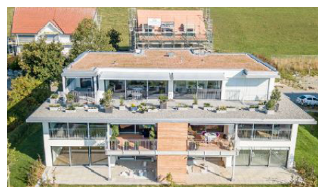
Riggisberg 2 Doppel Einfamilienhäuser und 10 Eigentumswohnungen