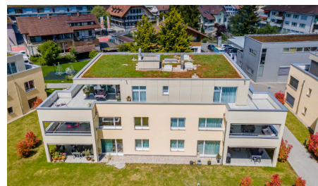
Neuenegg 5 1/2-Zimmer Attikawohnung